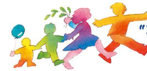
ASSOCIAZIONE "FAMIGLIE IN CAMMINO" DI CASTELLEONE