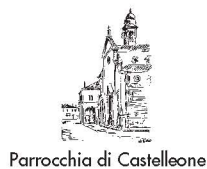
Parrocchia di Castelleone

Per le coppie giovani, e per i giovani che si accingono a formare una famiglia, proponiamo alcuni incontri in cui affrontare temi che possano aiutare ad apprendere ed a diffondere la sobrietà come stile di vita.