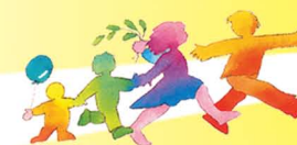
ASSOCIAZIONE "FAMIGLIE IN CAMMINO" DI CASTELLEONE